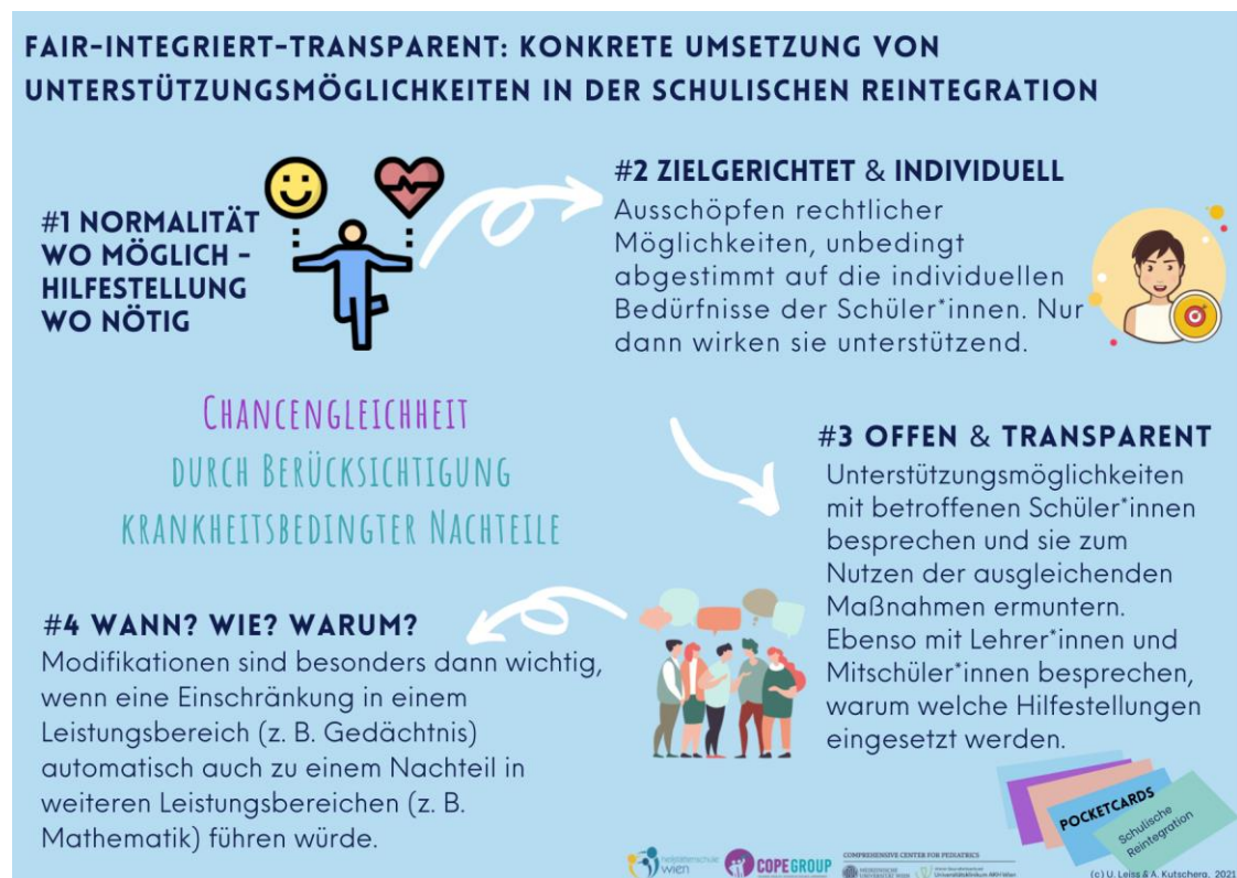
Abbildung 2: Empfehlungen zur konkreten Umsetzung von Unterstützungsmöglichkeiten in der schulischen Reintegration | Quelle: siehe Abbildung 1

Solche und andere Faktoren können Unterstützungsmaßnahmen zum Teil unfair oder sogar als Vorteil erscheinen lassen und längerfristig einen angemessenen Umgang mit Spätfolgen erschweren. Die betroffenen Schüler*innen, Eltern, Lehrer*innen und Mitschüler*innen finden sich häufig in verschiedener Hinsicht in einem schwierigen Balanceakt zwischen Wunsch nach Normalität und fairem Ausgleich krankheitsbedingter Nachteile wieder. Abbildung 2 stellt zusammenfassend dar, wie durch offene und transparente Kommunikation für alle Beteiligten eine möglichst gute Balance errichtet werden kann.