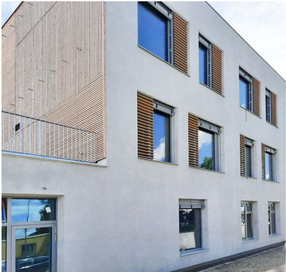
Abb. 2: Bildungscampus Puntigam: Fassade mit Silikatfarbe und Verschattungselementen und unbehandeltem Vollholz