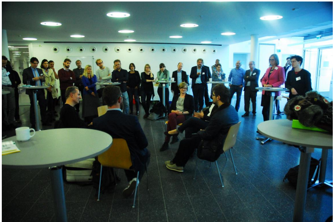
Abb. 1: Studierende und Lehrkräfte bei der Wertediskussion im Fishbowl anlässlich der Tagung „Brückensteine – Medienethik als Aufgabe der Medienbildung“ (eigene Aufnahme) | Foto: WuL Archiv

Da jede Lehrperson eine eigene Werteordnung in sich trägt und in einer persönlichen Wertewelt lebt, wird diese für die Schüler*innen nur bedingt oder mittelbar erfahrbar. Sie leiten sich durch Beobachtung ab, was der jeweiligen Lehrkraft wichtig oder wertvoll ist. Diese Dechiffrierung des Handelns oder der eigenen Positionierung, insbesondere die sprachliche Artikulierung ist ein entscheidender Prozess im Wertelernen von Schüler*innen: In der Sichtbarkeit eines Aspekts des Wertekosmos einer Lehrperson tritt die Lehrer-Schüler-Beziehung in eine personale Bindungsebene. Dabei ermöglicht sprachliche Bildung umfassendes Verstehen. Sie kann nicht durch Zahlen, Statistiken und Meinungsumfragen ersetzt werden, denn auch diese müssen begründet, gedeutet und bewertet werden.