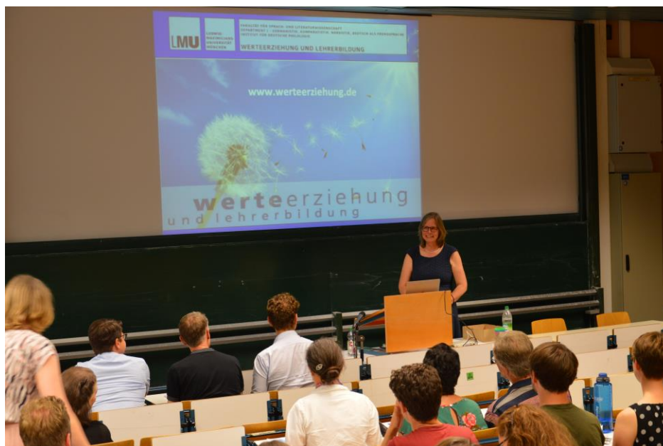
Abb. 3: Feier zum 5-jährigen Bestehen der Forschungsstelle an der LMU

Fächerübergreifende Projekte wie „Werte in Europa er-lesen und er-fahren“ oder „Brückensteine. Phasenverbindende Professionalisierung in der Lehrerbildung“ sowie der forschungsorientierte Ansatz „KommunikationsART in analogen und digitalen Lehr-Lernprozessen“ haben für die Konzeption der Forschungsstelle hohe Bedeutung. Zuletzt wurde im Dezember 2019 in Präsenz beim Fachtag „LESEN – Nein Danke? Herausforderungen der Digitalität“ für ein großes Publikum aus Schule und Universität eine Auseinandersetzung mit dieser dringlichen Aufgabe angeregt.